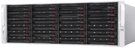
DW-BJE2U / DW-BJER2U DW-BJER3U / DW-BJER4U (los que se muestran)