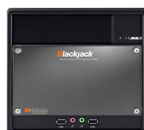
DW-BJCLIENT/ DW-BJCLIENT2 Station de travail Blackjack®